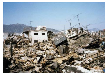
地震による被害写真