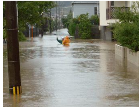
仁淀川水系宇治川の浸水状況