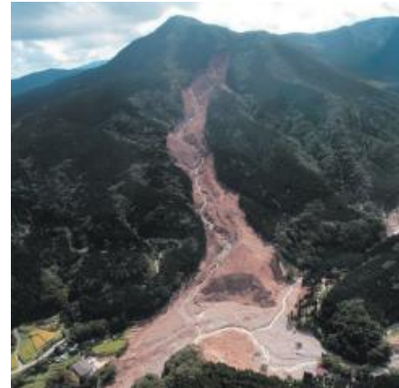
土石流による被害写真