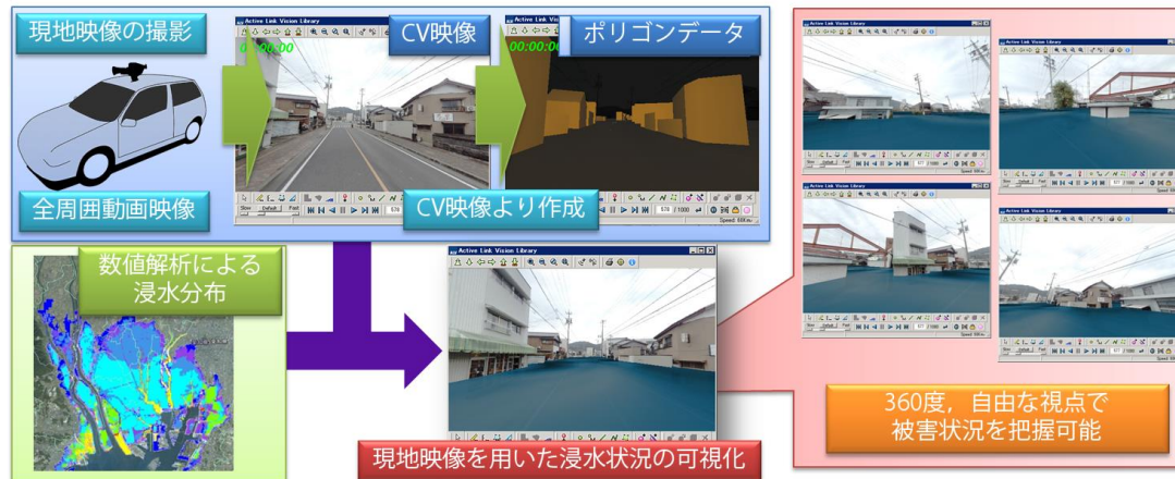
現地映像を用いた3次元災害リスク可視化技術手法の概要